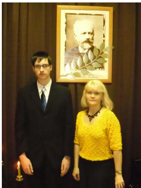
Novēlu visiem Birzgales jauniešiem mūziķiem -dziedātājiem un instrumentu spēlētājiem turpmākos panākumus!