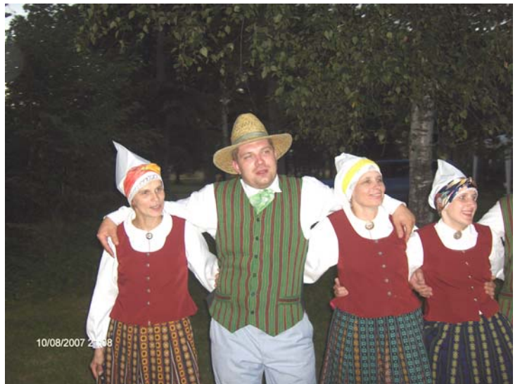
Valles deju kolektīvā deju arī vairāki birzgalieši