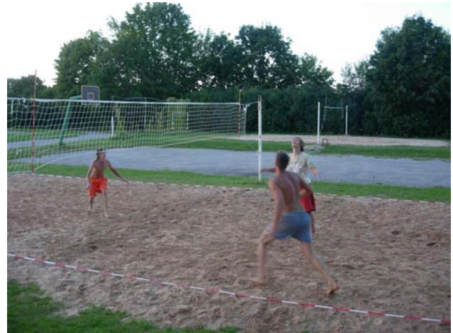
Vai čempionāta līderi arī uzvarēs?