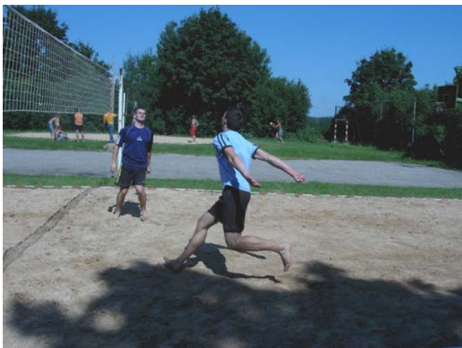
Laikam bumba atrodas tik augstu, ka neredz