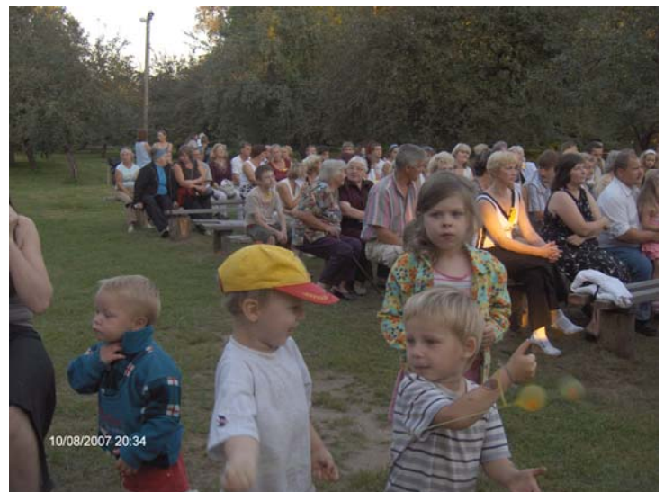
Pasākumā piedalījās visas paaudzes