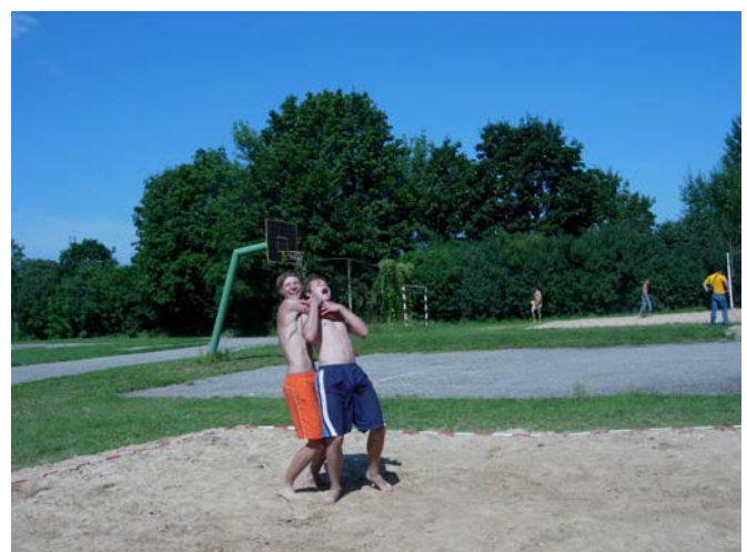
Uzvarētāju rituāla deja