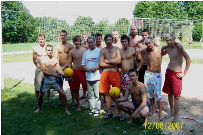
Dalībnieki pirms izšķirošā starta