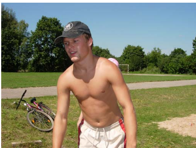
ja kāds atnestu ūdeni, es varētu izdarīt servi