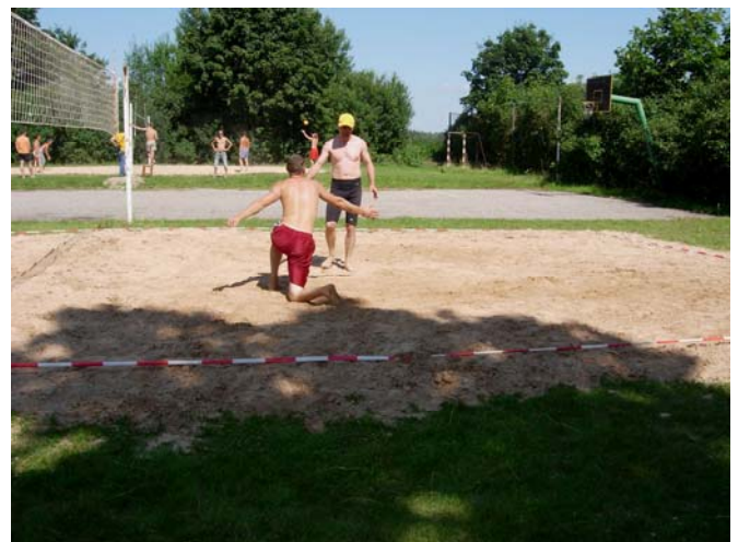
Piedod, es vairāk tā nedarīšu...