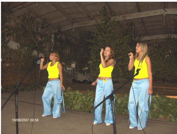
Publikas atzinību par skanīgajām dziesmām izpelnījās gan lielās, gan mazās Ķeguma sienāzītes